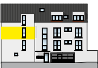
Ansicht Nord 2. OG | Wohnung 3