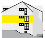
Ansicht Ost 2. OG | Wohnung 3