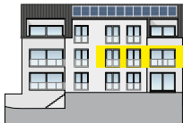
Ansicht Süd 2. OG | Wohnung 3